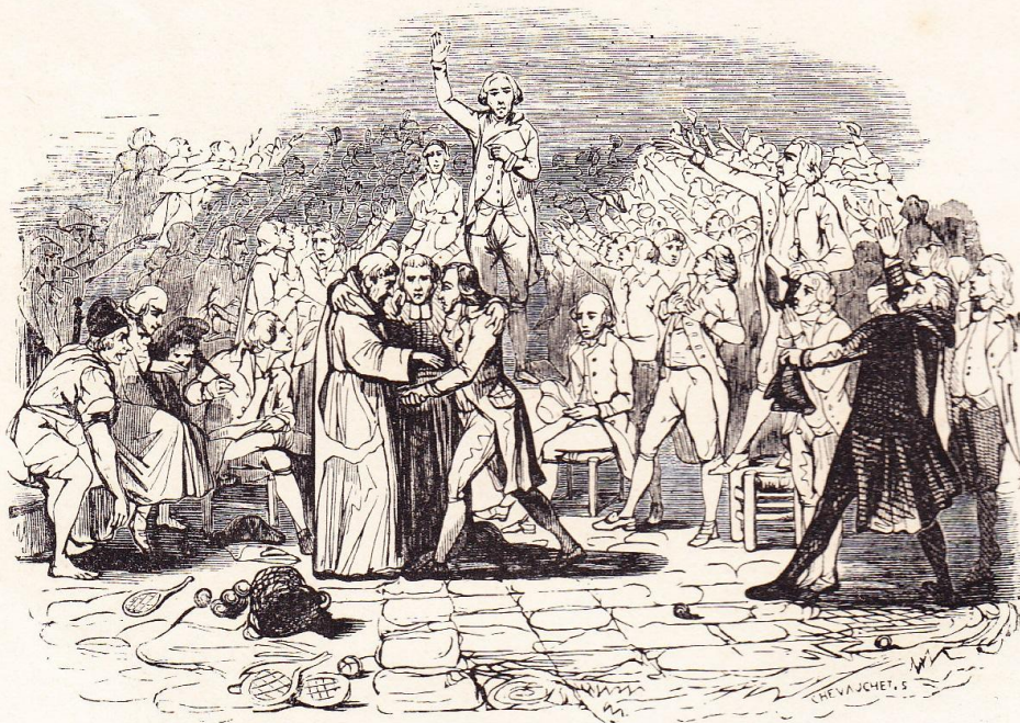
Le serment du Jeu de Paume.